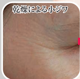
乾燥による小ジワ