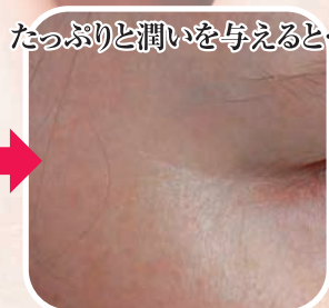
たっぷりと潤いを与えると...