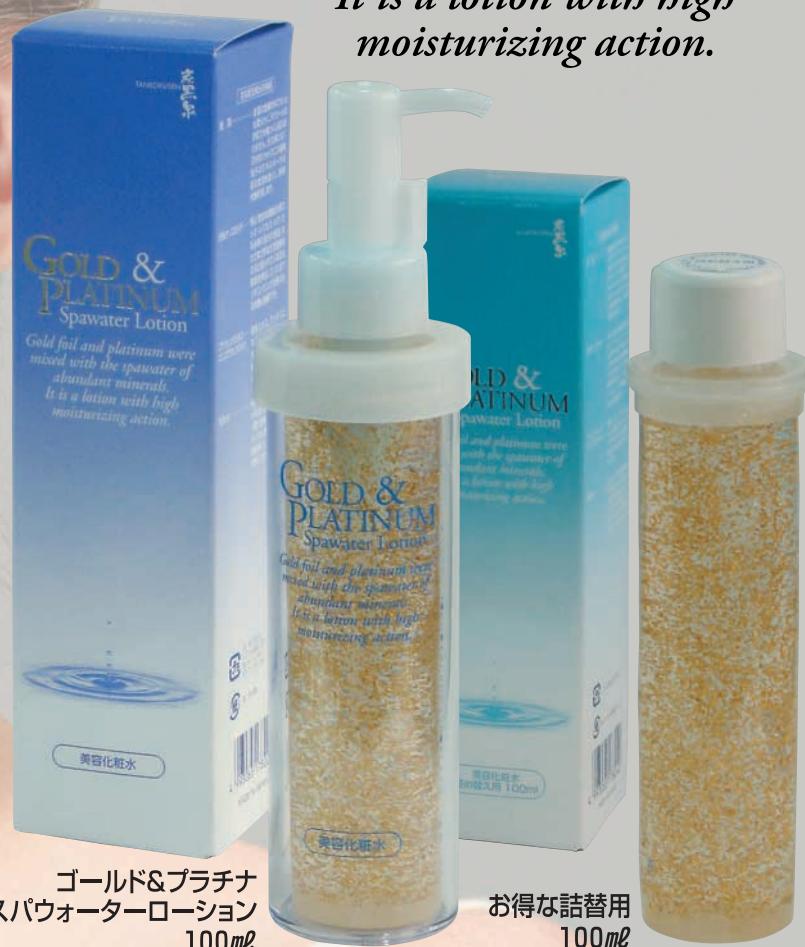
ゴールド&プラチナ スパウォーターローション 100ml