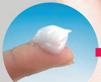
クリームを手に取りお肌になじませます。