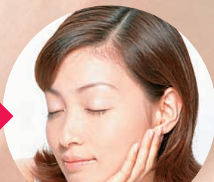
マッサージするようにお肌になじませてお手入れ完了!!