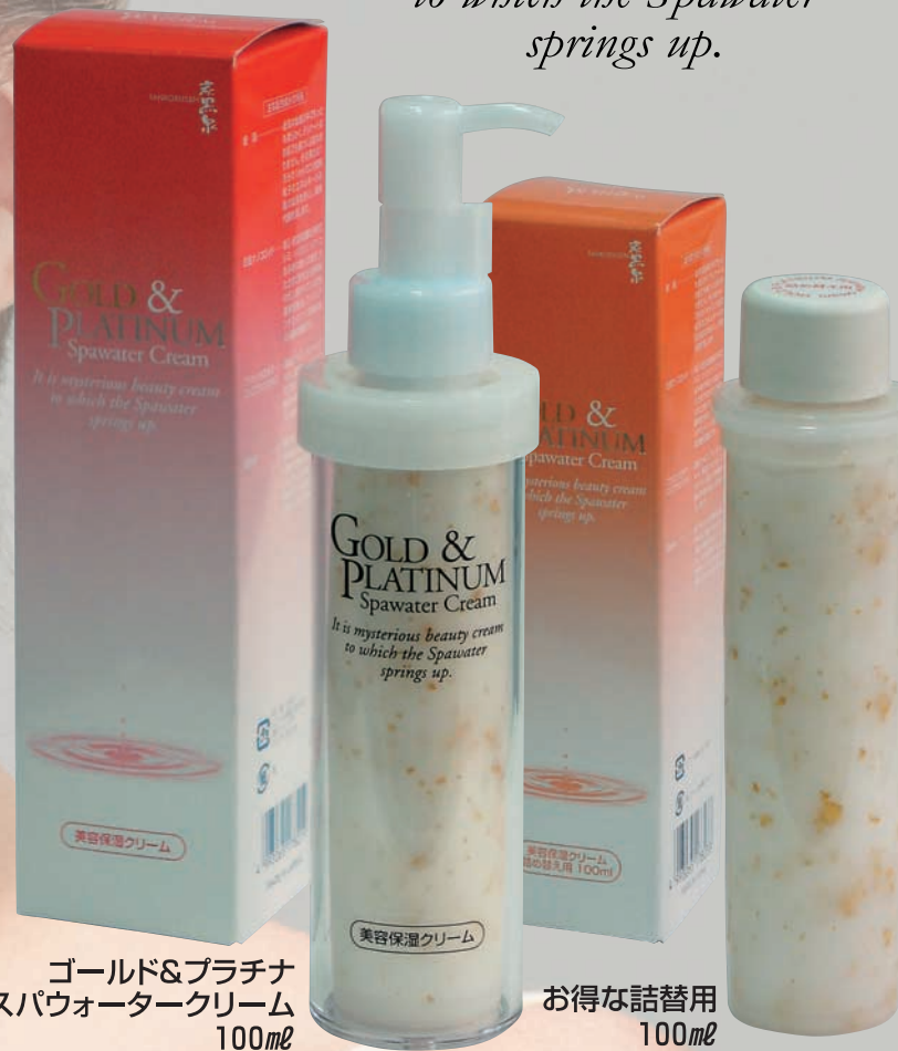
ゴールド&プラチナ スパウォータークリーム 100ml