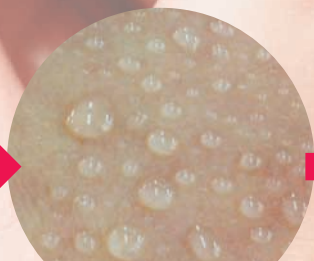
クリームから湧き出る美肌エッセンス。